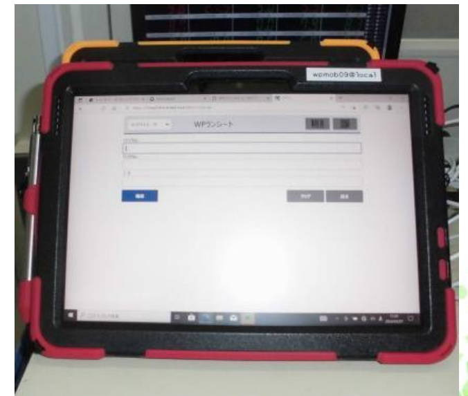
DX導入による事務所内でのペーパーレス化を推進 キントーン開始による、“紙削減”