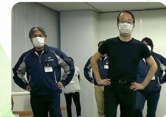
開眼片足立ち (静的バランス)