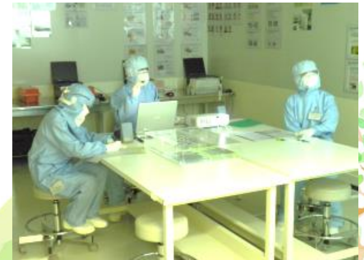
中学校、高校生向けの職場体験学習