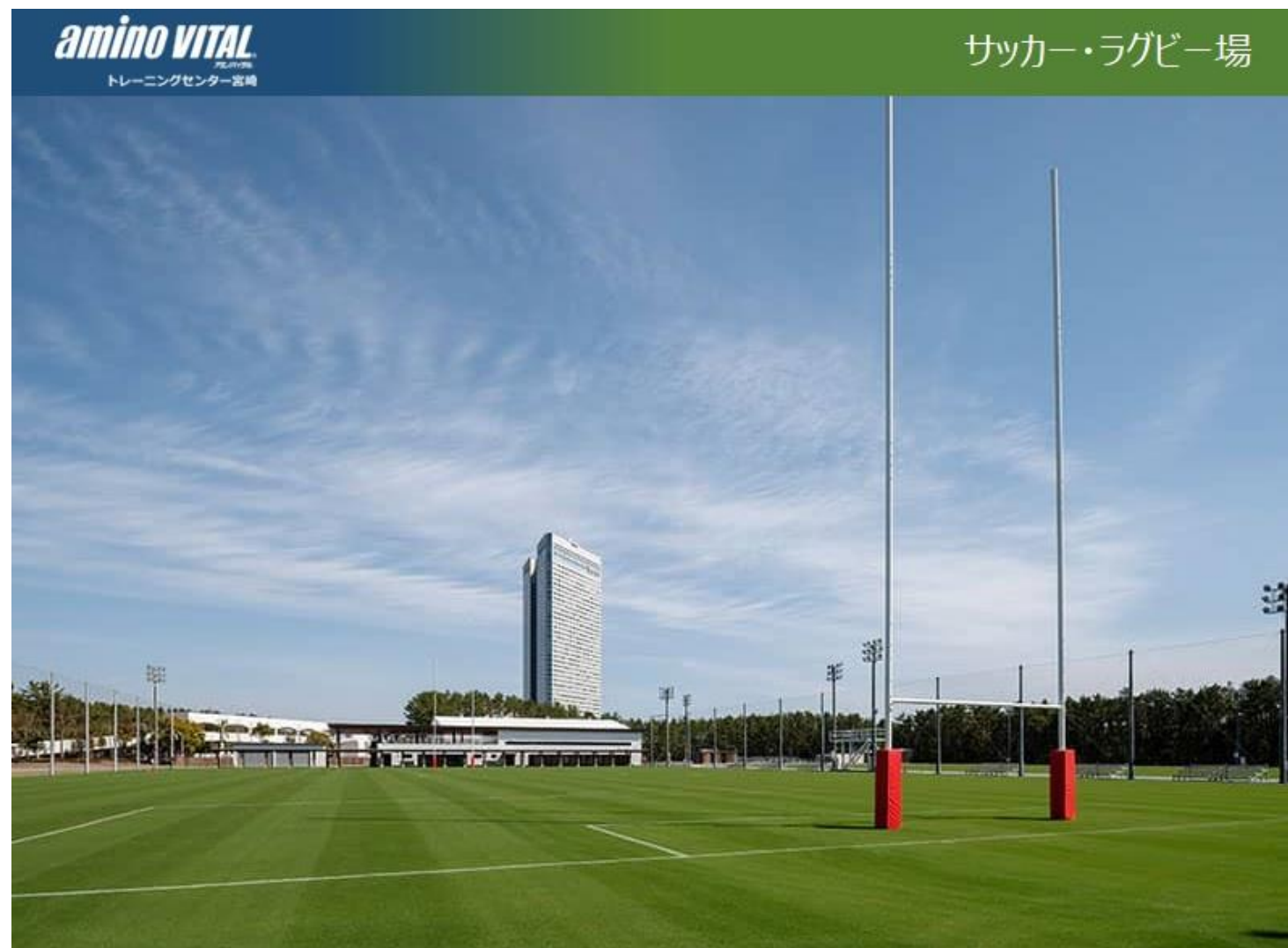
国立競技場などで使用されている、最高品質の天然芝「ティフグラウンド」を採用

この画期的な認識を追い風として、かつ、多くの部門にまたがる「開発と平和のためのスポーツ」活動とプログラムのこれまでの成果を土台に、スポーツは今後も、SDGsのための活動とその実現を支援することで、グローバルな開発を前進させてゆくことでしょう。国連は、SDGsの17項目それぞれの達成に向けた課題に取り組む潜在的な能力を備えた重要かつ強力なツールとして、スポーツがその役割を果たすことを期待しています。