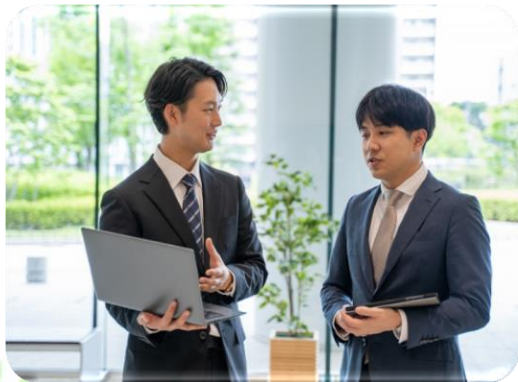
メンタルヘルス キャリアカウンセリング相談