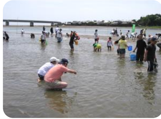
潮干狩りイベント