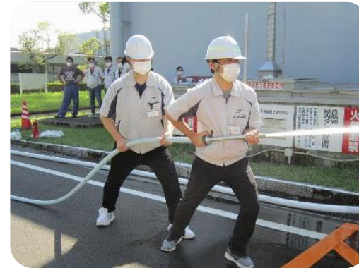
屋外消火栓消化訓練