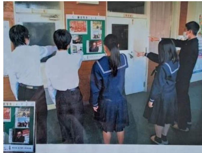
中学校への学習支援

地域の若者たちがより高い教育を受ける機会を得ることができます。その結果、将来的には高度な職業に就くことができ、地域の労働力として社会経済に貢献することが期待されます。