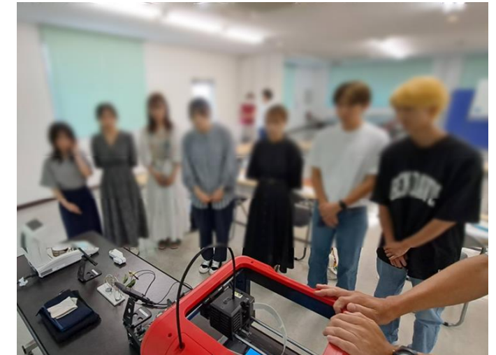
大学生向け産学連携マネジメントセミナー