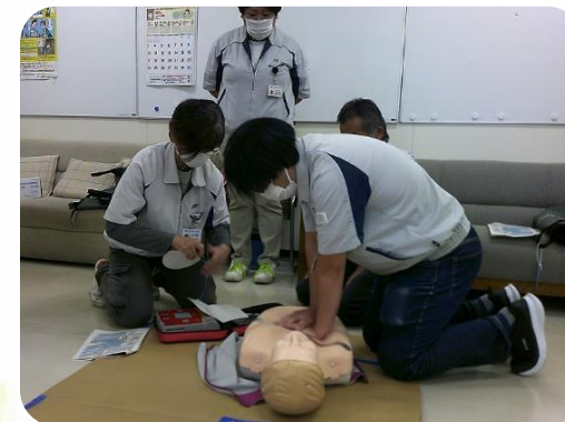
心配蘇生法訓練、AED訓練